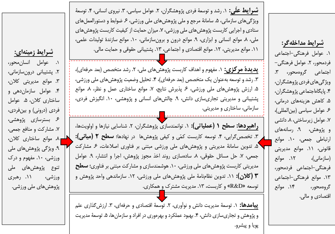
شکل ۲: الگوی پارادایمی توسعه کاربست پژوهش‌های ملی ورزشی

قضیه دوم: عوامل «رشد و توسعه فردی پژوهشگران»، «عوامل سیاسی»، «نیروی انسانی»، «توسعه ویژگی‌های سازمانی»، «سامانه مرجع و ملی پژوهش‌های ملی ورزشی»، «ضوابط و دستورالعمل‌های ستادی و اجرایی کاربست پژوهش‌های ملی ورزشی»، «میزان حمایت از کیفیت کاربست پژوهش‌های ملی»، «موانع انسانی و ابزاری»، «موانع برون و درون سازمانی»، «موانع سازنده تولیدات علمی»، «موانع مدیریتی»، «موانع اقتصادی و اجتماعی» و «پشتیبانی حقوقی و حمایت مالی» به‌عنوان عوامل موجهه (علی) در «توسعه کاربست پژوهش‌های ملی ورزشی» در کشور نقش ایفا می‌کنند.