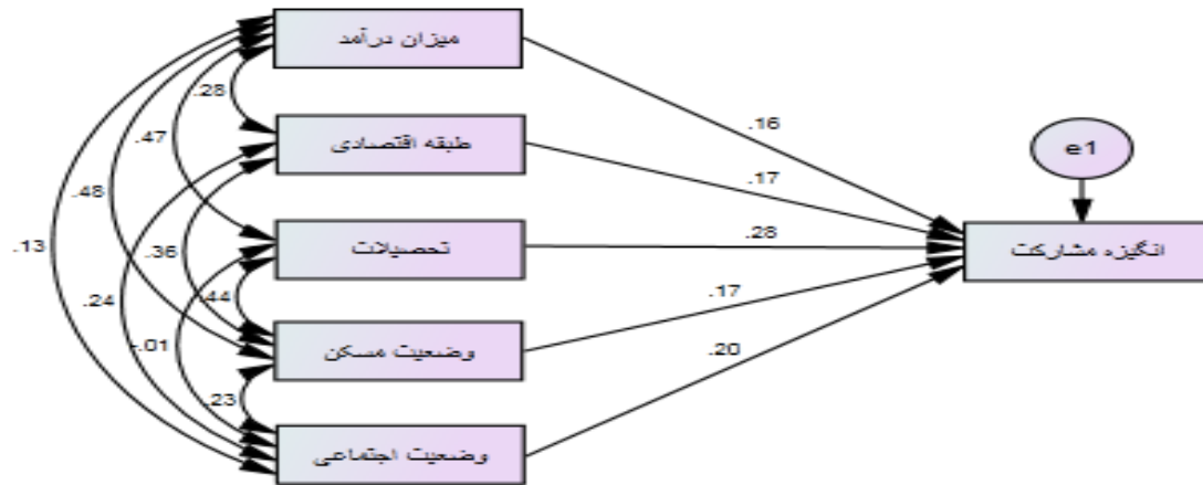
شکل ۲: ضرایب استاندارد مدل روابط بین وضعیت اجتماعی-اقتصادی با انگیزه مشارکت در فعالیت تندرستی

پس از بررسی مفروضه‌ها و حصول اطمینان از برقراری آن‌ها، به منظور ارزیابی مدل مورد بررسی، از تحلیل مسیر استفاده شد. مدل بررسی شده به همراه شاخص‌های مربوط به برازش مدل در ادامه ارائه شده است.