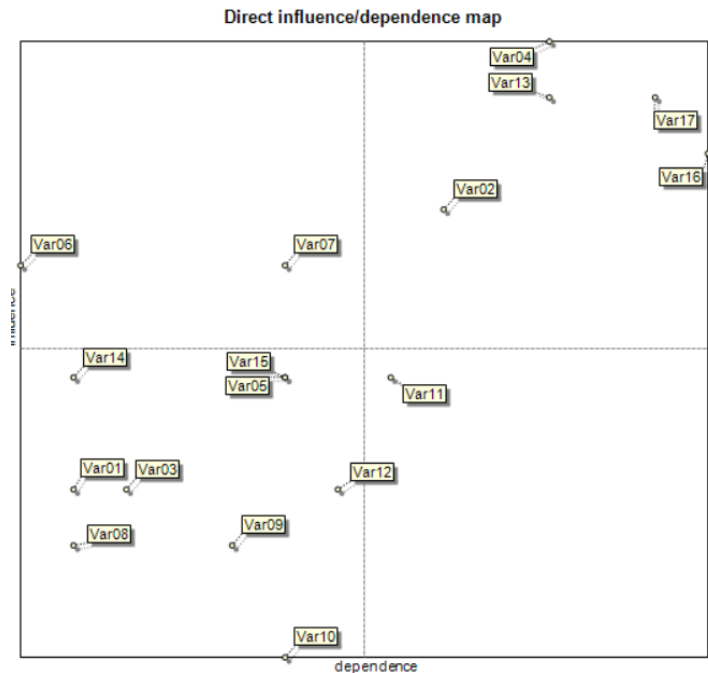
شکل ۲- نمودار پراکنده‌گی متغیرها مستقیم و جایگاه آن‌ها در محور تأثیرگذاری و تأثیرپذیری