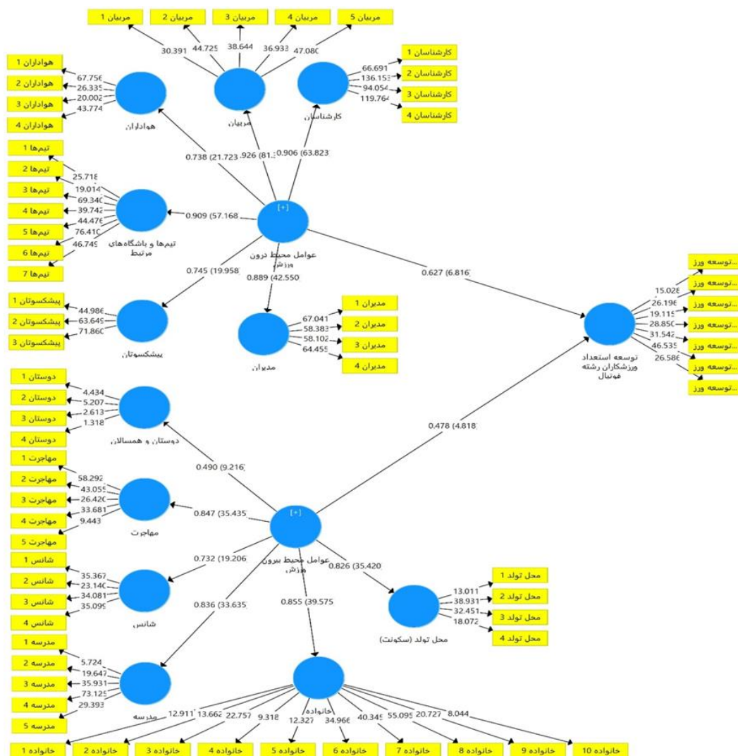
شکل ۲: مدل نهایی پژوهش (ضریب اثر و ضرایب معنی داری)

به منظور برازش مدل کلی (هر دو بخش مدل اندازه‌گیری و ساختاری) از معیار SRMR استفاده شد که مقدار آن باید از ۰/۱ کمتر باشد. با توجه به مقدار به دست آمده (SRMR=۰/۰۹)، مدل اندازه‌گیری و ساختاری از برازش مناسبی برخوردار است، یعنی در مجموع مدل اندازه‌گیری و ساختاری، کیفیت مناسبی در تبیین متغیر درون‌زا پژوهش دارد.