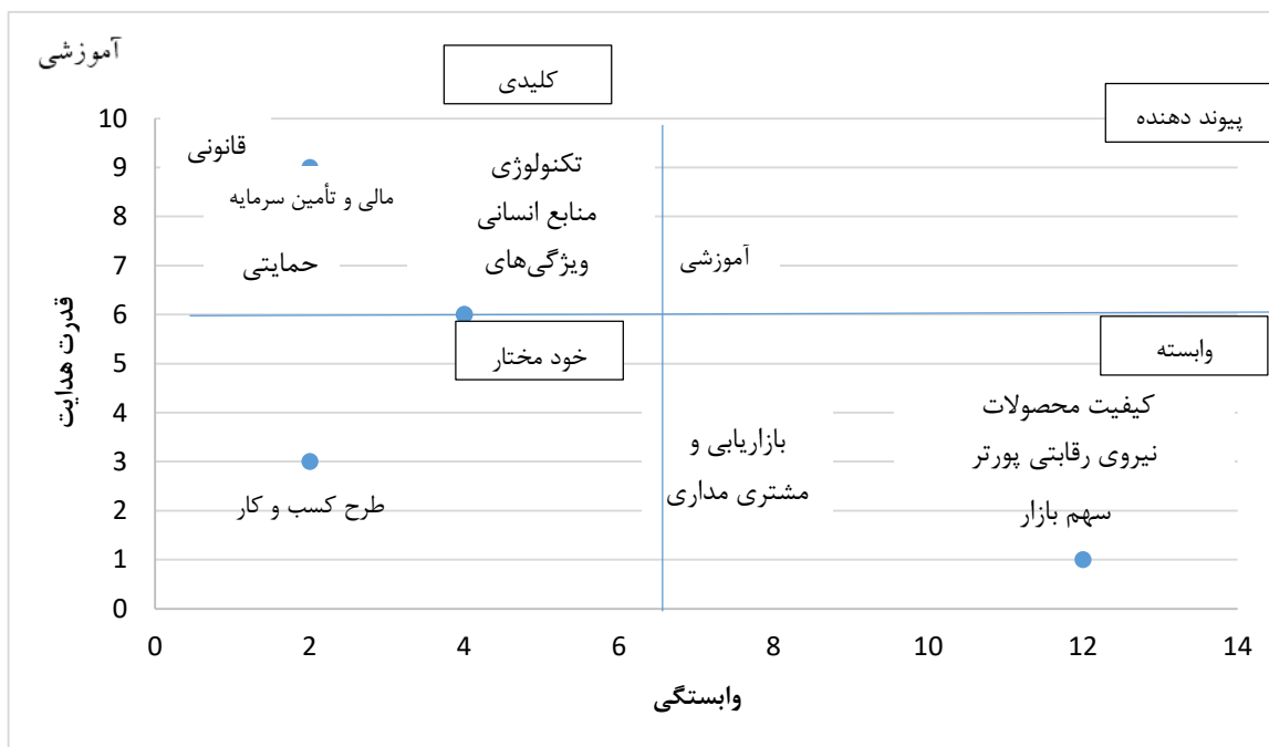
شکل ۲: نمودار تحلیلی MICMAC

همان گونه که در نمودار MICMAC مشخص شده است متغیرهای تکنولوژی، منابع انسانی، ویژگی های مدیریتی، ساختار قانونی، ساختار مالی و تأمین سرمایه و ساختار حمایتی متغیرهای کلیدی اثرگذار بر موفقیت کسب و کارهای کوچک و متوسط ورزشی است. در مقابل، متغیرهای کیفیت محصول، بازاریابی، مشتری مداری و سهم بازار متغیرهای وابسته (پیامدی) این عوامل به شمار می رود.