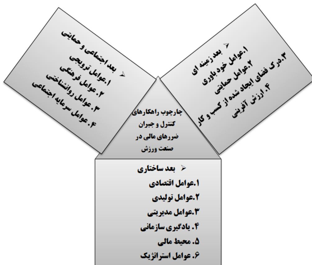
شکل ۲: مدل مفهومی تحقیق